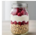
Raspberry Wonder 04-02

Joghurts Ein Naturjoghurt mit Himbeeren und einem knusperhafter Müsli. Zur Süßung ist Honig beigelegt.