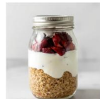
Strawberry Spark 04-03

Joghurts Naturjoghurt mit Erdbeeren und einem knusperhafter Müsli. Zur Süßung ist Honig beigelegt.