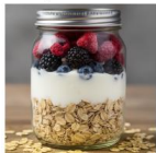
Wildberry Dream 04-01

Joghurts Ein Naturjoghurt mit Waldbeeren und einem knusperhafter Müsli. Zur Süßung ist Honig beigelegt.