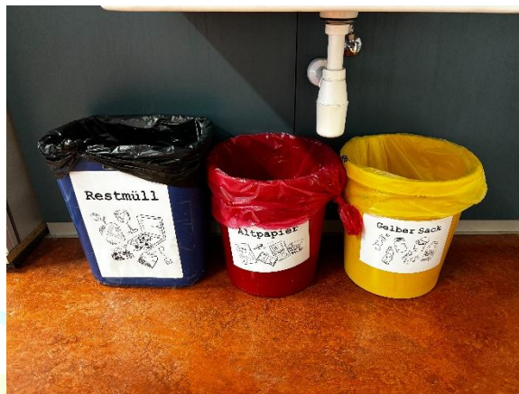
Abbildung 3: Mülltrennung