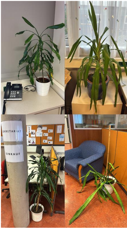
Abbildung 2: Pflanzen im Büro